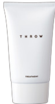
スロウ トリートメント エアリー

洗浄成分にこだわりヘアカラーによるダメージをケアし、美しい髪色へ導く、ふんわりとやわらかな仕上がりのシャンプー。