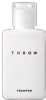
スロウ シャンプー エアリー

洗浄成分にこだわりヘアカラーによるダメージをケアし、美しい髪色へ導く、ふんわりとやわらかな仕上がりのシャンプー。